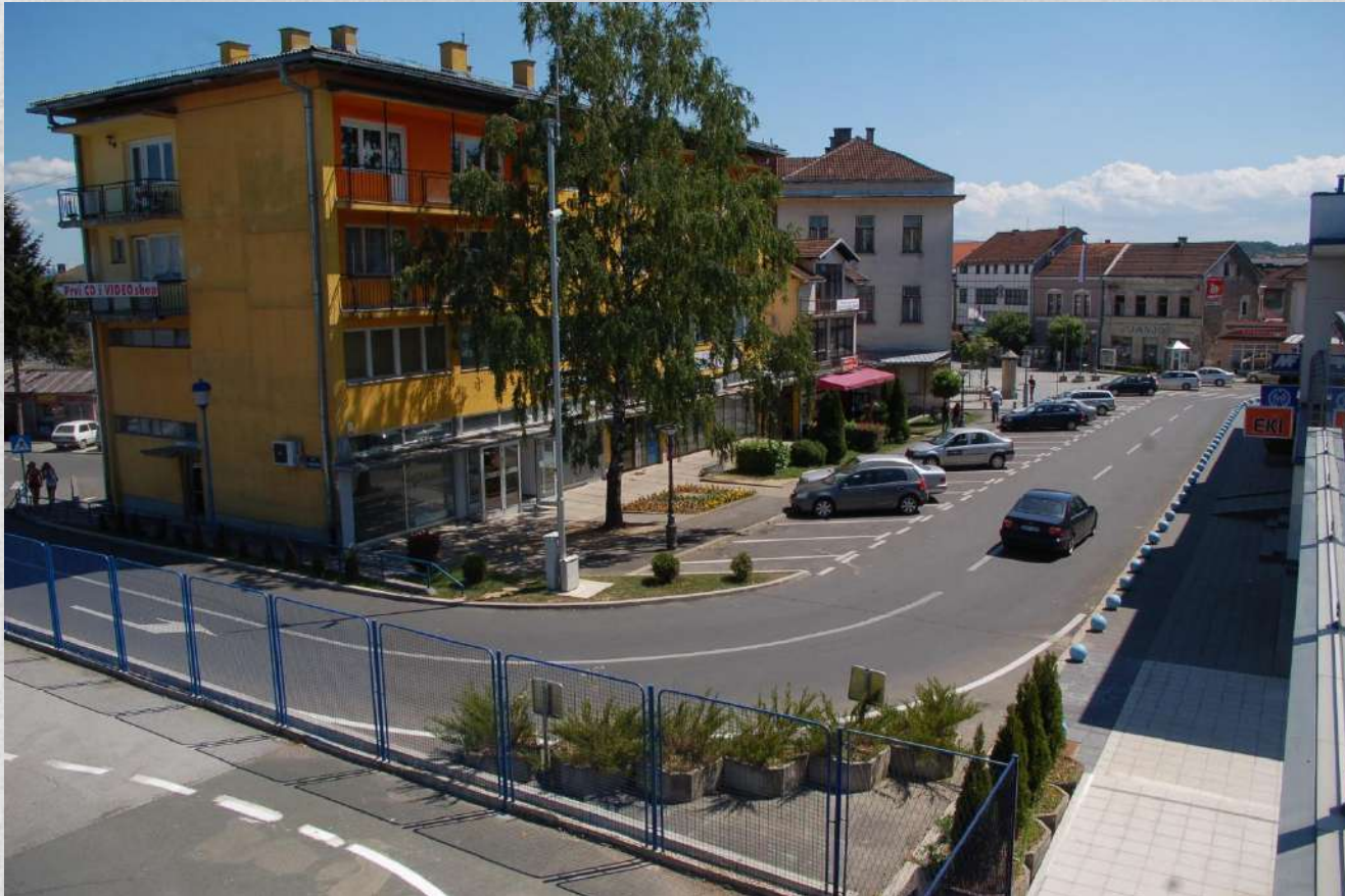
Detalj iz centra