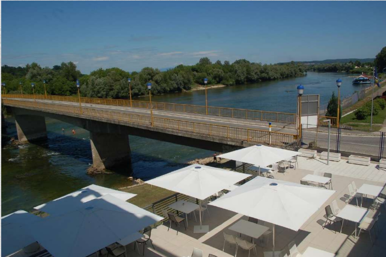
Rijeka Una - most, granični prelaz