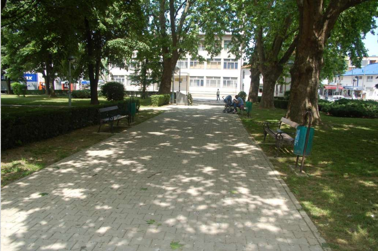
Detalj iz Gradskog parka