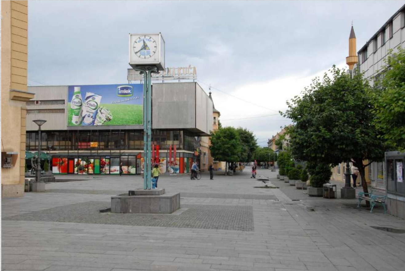
Pogled na šetalište