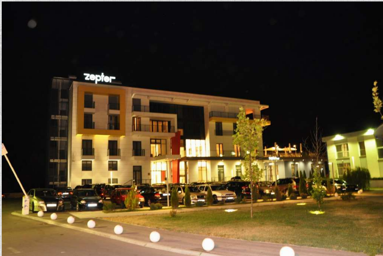
Zepter Hotel - noću

POLOŽAJ - POGODNOSTI - POTENCIJAL - POUZDANOST - PRIVLAČNOST