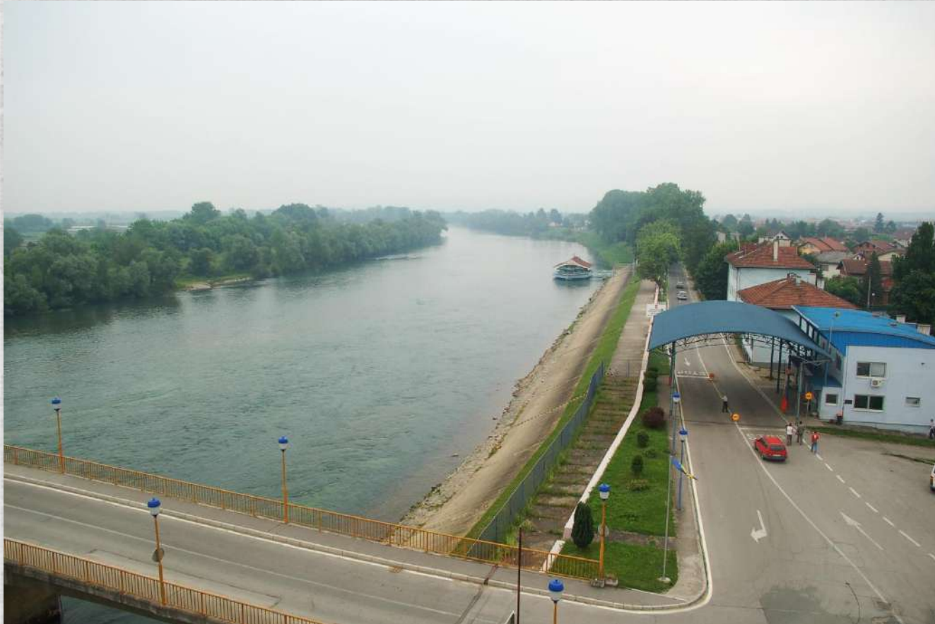
Pogled na Unu i gradski granični prelaz